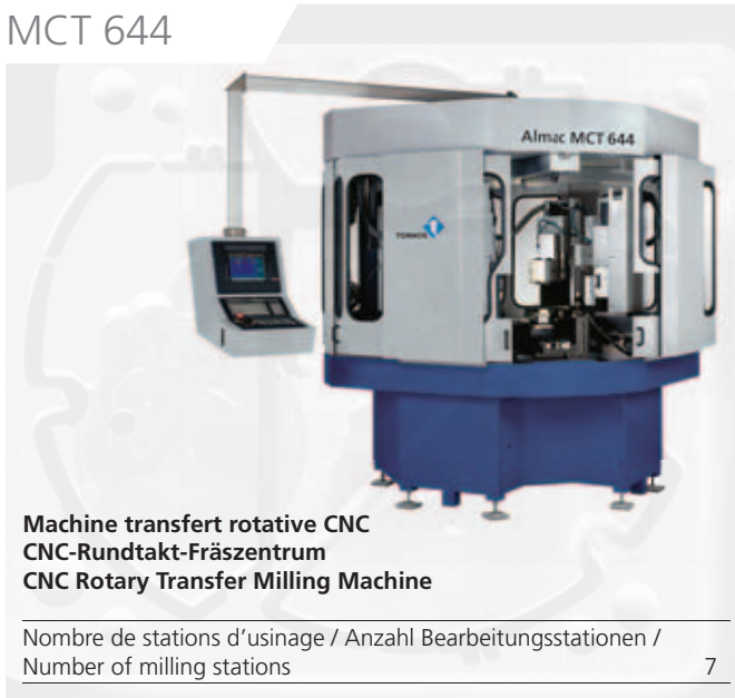
Machine transfert rotative CNC CNC-Rundtakt-Fräszentrum CNC Rotary Transfer Milling Machine

Nombre de stations d'usinage / Anzahl Bearbeitungsstationen / Number of milling stations