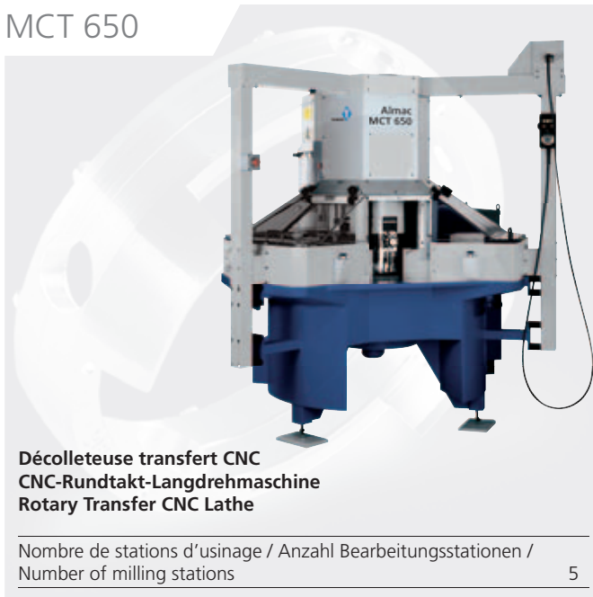
Décolleteuse transfert CNC CNC-Rundtakt-Langdrehmaschine Rotary Transfer CNC Lathe

Nombre de stations d'usinage / Anzahl Bearbeitungsstationen / Number of milling stations