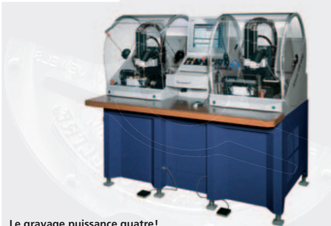
GR 600 Twin

Le gravage puissance quatre! Gravierleistung hoch vier! Engraving to the power of four!