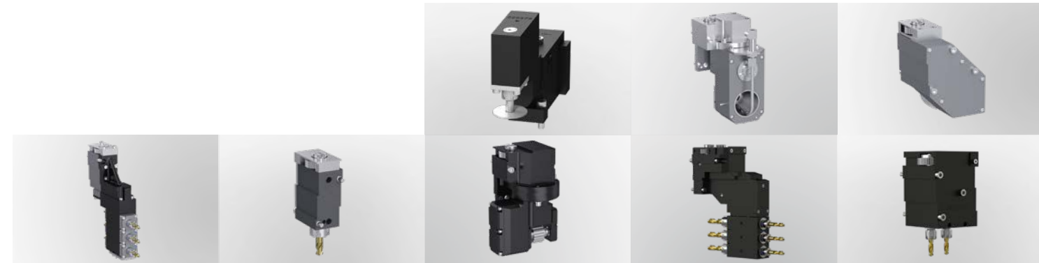
三位端面轴向正/反向钻削/铣削单元 ○ 钻削/铣削主轴 ESX20 ○ 滚齿装置 ○ 可调角度的钻削/铣削装置 ○ 铣主轴 2 x ESX11 最大可达 8,000 rpm ○

开槽单元 ○ 螺纹旋风铣单元，最大转速5,000 rpm，角度± 15°，最大直径10 mm ○ 多边形铣削单元，最大转速5,000 rpm，多边形刀具直径80 mm ○