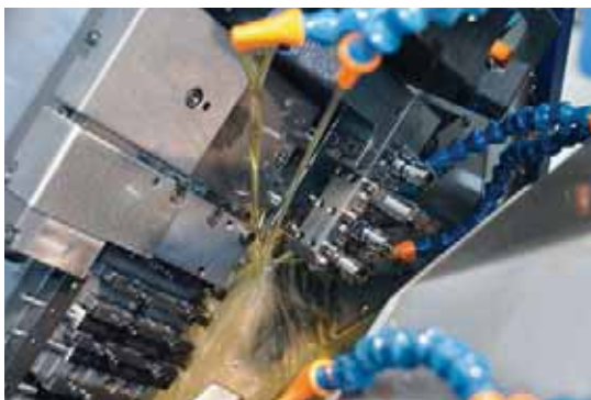
L'huile Motorex Ortho NF-X est idéale pour tous les postes d'usinage de TS Décolletage SA. La collaboration entre Tornos et Motorex apporte un précieux avantage à l'utilisateur.