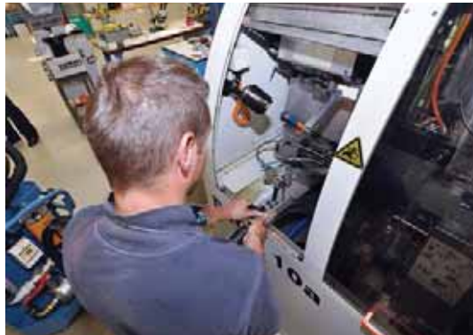
En fonction des matériaux usinés et des processus utilisés, les machines sont soumises à intervalles variables, à des opérations de nettoyage au cours desquelles l'huile de coupe est finement filtrée ou entièrement renouvelée. En l'absence d'alimentation centralisée, cette opération est réalisée séparément sur chaque machine.

Vu les expériences vécues avec les produits d'autres fournisseurs de lubrifiants, l'entreprise a vite pris conscience de la supériorité de ce nouveau liquide de coupe. Ce qui peut sembler identique de prime abord (de l'huile de coupe c'est de l'huile de coupe) est en réalité un facteur déterminant qui fait la différence en matière de qualité dimensionnelle, d'état de surface (Valeur R_a ), de durée de vie des outils et de temps d'usinage d'une pièce. L'huile de coupe hautes performances Motorex Ortho NF-X a démontré ses «qualités intrinsèques» en réduisant de 31% le temps d'usinage de ladite pièce médicale, un véritable record! Le tout bien entendu dans le respect absolu des tolérances les plus contraignantes et des états de surface exigés par le client. Sans chlore ni métaux lourds, Swisscut Ortho NF-X Motorex permet d'usiner parfaitement, avec une seule et même huile de coupe, aussi bien les nuances d'acier fortement alliées ou les aciers pour implants que les métaux lourds non ferreux ou l'aluminium. Dans le domaine des technologies de production, il s'agit là d'une avancée majeure qui offre la plus grande liberté possible aux utilisateurs. La même huile de