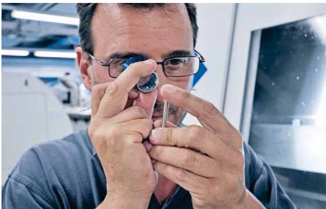
Dirigée dès sa fondation par des entrepreneurs, la société TS Décolletage SA est certifiée ISO 9001-2000. Forte d'un équipement ultra-moderne, l'entreprise met tout en œuvre pour satisfaire par avance les plus hautes exigences de sa clientèle.

Mais seul le concours de deux partenaires capables de performances haut de gamme tels que Tornos et Motorex permet la satisfaction de cette devise exigeante. Une fois encore, le liquide de coupe s'avère être primordial dans la recherche d'un haut niveau de performance, ainsi que le montre la success-story avec Ortho NF-X 15 de la région du Sottoceneri.