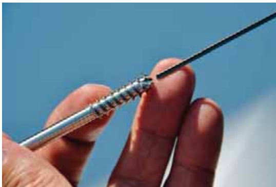
Les qualités avantageuses du liquide de coupe Ortho NF-X Motorex ont particulièrement retenu l'attention des responsables de TS Décolletage SA au cours de tests, lors d'un perçage profond de 200 mm. Aujourd'hui toute la production utilise ce liquide!

En 2007, l'entreprise s'est résolument tournée vers la haute technologie avec l'acquisition de nouveaux locaux entièrement climatisés et un fort investissement dans une nouvelle génération de machines. Grâce à ces efforts, des applications extrêmement complexes et exigeantes ont de plus en plus souvent été mises en œuvre de A à Z à Bedano. Avec les techniques de rectification super-finish, les usinages intérieurs sophistiqués dans différents matériaux (titane, acier inoxydable, CrNi, métaux non ferreux et métaux précieux), le liquide de coupe constitue un facteur décisif dans la qualité de la production. Pouvoir réaliser un perçage profond de 200 mm dans une pièce médicale dans de l'acier inox 1.4472 présentant une dureté de base élevée a été un élément déterminant de l'adoption de l'huile de coupe universelle hautes performances Motorex Ortho NF-X pour l'ensemble de la production de l'entreprise. Les résultats obtenus avec l'huile de coupe précédemment utilisée étaient insuffisants en termes de qualité dimensionnelle et de temps d'usinage des