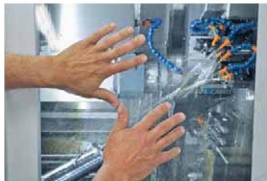
L'absence de composants problématiques dans le fluide Ortho NF-X ainsi que son facteur de nébulisation particulièrement bas, permettent d'atteindre un niveau très élevé de qualité de mise en œuvre.