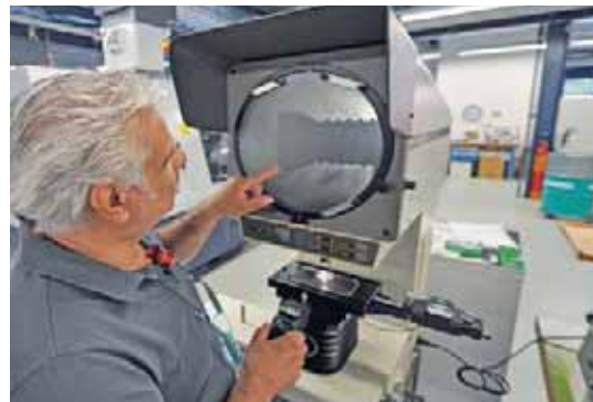
Le contrôle qualité est une étape particulièrement longue mais son importance est capitale pour un résultat final parfait. Chez TS Décolletage à Bedano des procédures de contrôle appropriées sont appliquées à cet effet en fonction des besoins spécifiques des divers clients.